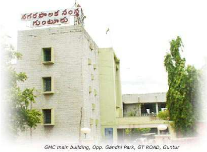
GMC main building, Opp. Gandhi Park, GT ROAD, Guntur