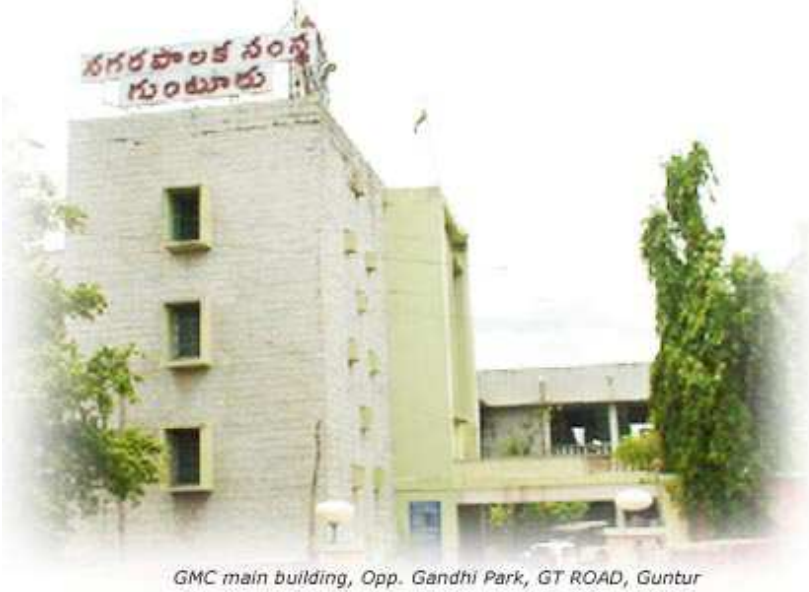
GMC main building, Opp. Gandhi Park, GT ROAD, Guntur